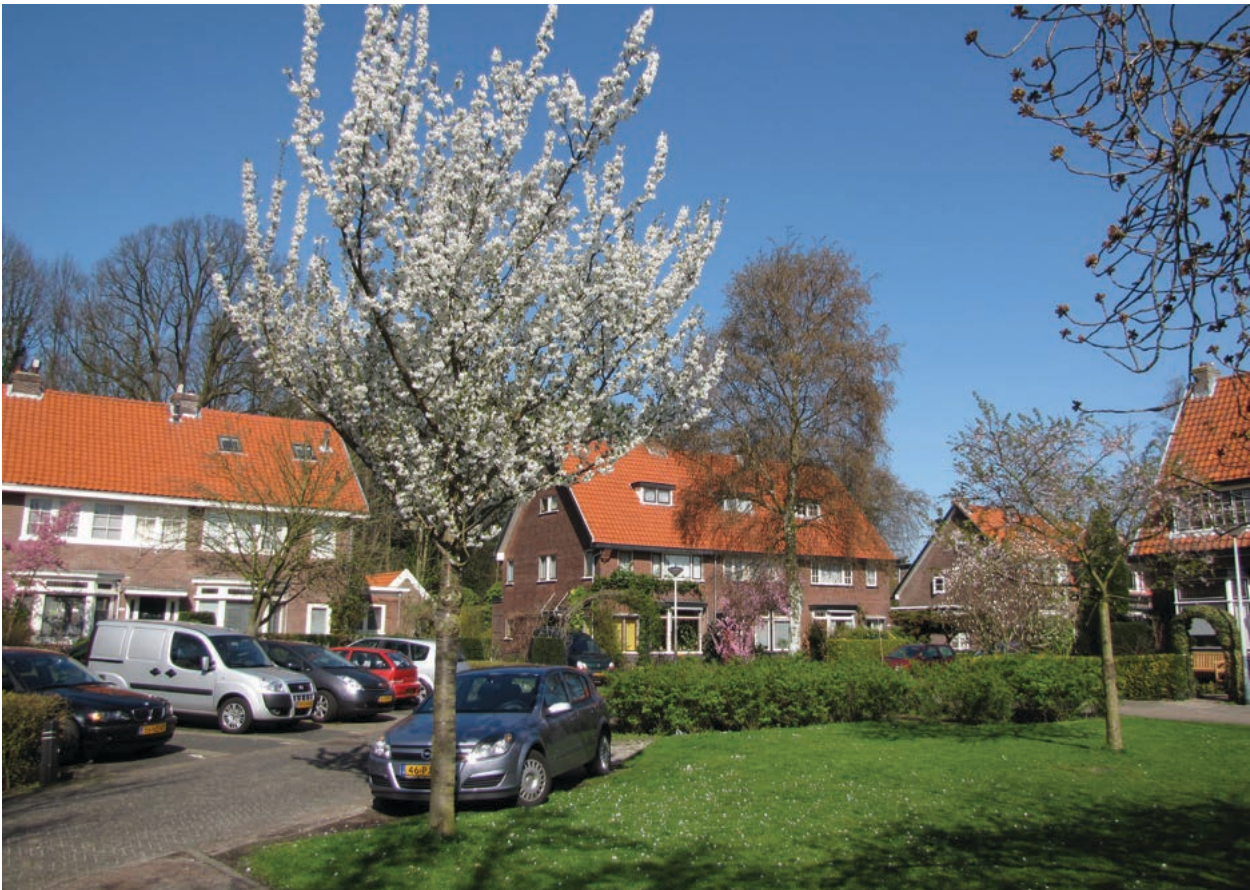
Afbeelding 4. De Schaepmanlaan in Bloemendaal, hier lag de blekerij In de Bogt. Foto J. Morren 2009.

blekerij In de Bogt wordt behandeld in de geschiedenis van de blekerij Garenvreugd. Van de blekerij is in het huidige landschap niets meer terug te vinden. Een deel van de Schaepmanlaan in Bloemendaal doorkruist nu het gebied van de voormalige blekerij In de Bogt.