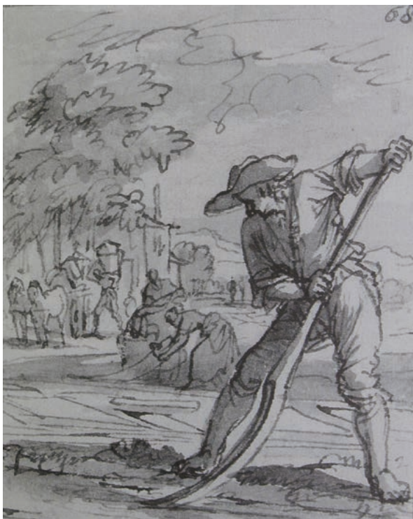
Afbeelding 1. Een blekersknecht aan het werk, hij schept met een hoos water uit de gietsloot en werpt dit over het bleekgoed.

Het onderhoud van deze sluis blijft bij hen. Hierbij ook de wegen, dammen en de wateringen (waaronder de giet-sloten).